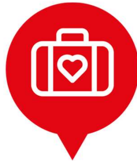
Uitstroom naar werk